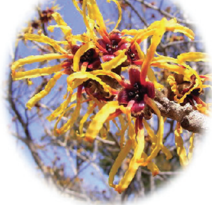
満作(まんさく) 花言葉…ひらめき・直感・神秘など

春に他の花に先駆けて咲くので「まず咲く花」ということでだんだんと「まんさく」になっていったらしい。また、花がたくさんつくので「豊年満作」から命名されたとも。欧米で人気があり、「魔女の榛(はしばみ)」という名前もついている。