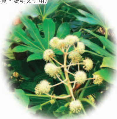
八手(やつで) 花言葉…分別・親しみ

日陰でもよく育つ。掌状に7~11裂する葉を「手」に見立てた。実際には7裂または9裂するものが多いようだ。「八」は“数が多い”という意味からの命名。別名「天狗の羽団扇」(てんぐのはうちわ)。でかい葉っぱに、魔物を追い払う力があると考えられてこの別名が ついた。